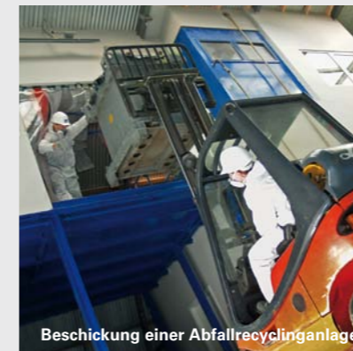
Beschickung einer Abfallrecyclinganlage